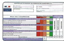
CEPC valable 4 mois